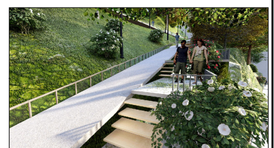
VISTA PROPUESTA RECREACION CON TRATAMIENTO ESPECIAL