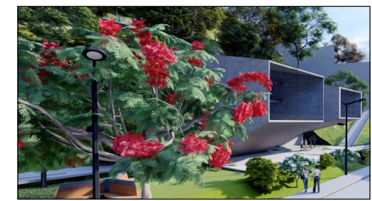
VISTA PROPUESTA EDIFICIO DE ASISTENCIA SOCIAL