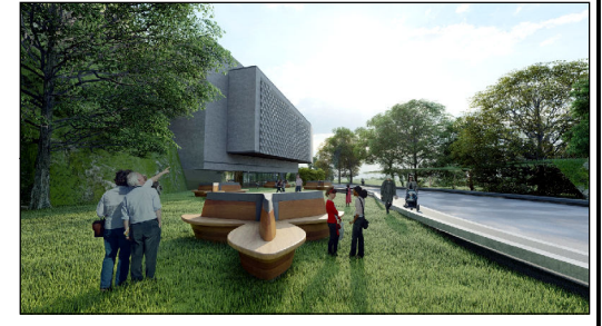
VISTA PROPUESTA EDIFICIO CULTURAL