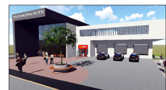
VISTA PROPUESTA COMISARIA