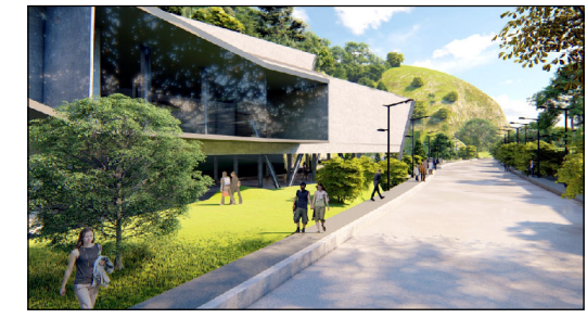
VISTA PROPUESTA EDIFICIO CULTURAL