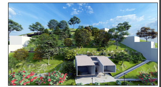
VISTA PROPUESTA EDIFICIO DE ASISTENCIA SOCIAL